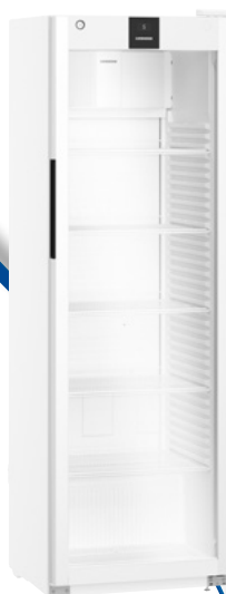
MRFVD 4011 WX