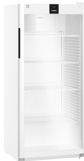
MRFVD 5511 WX